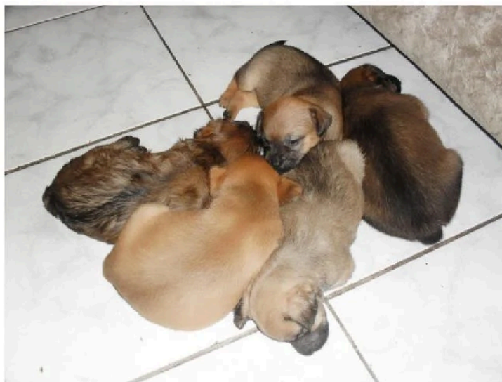
A adoção responsável de cães e gatos abandonados é incentivada pela nova lei