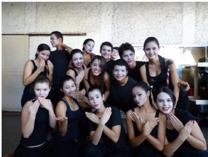
Alunos do Centro de Educação Profissional em Artes Basileu França durante aula

em Joinville (SC), São Paulo e até mesmo em Nova York. Cerca de 5500 alunos são atendidos por ano.