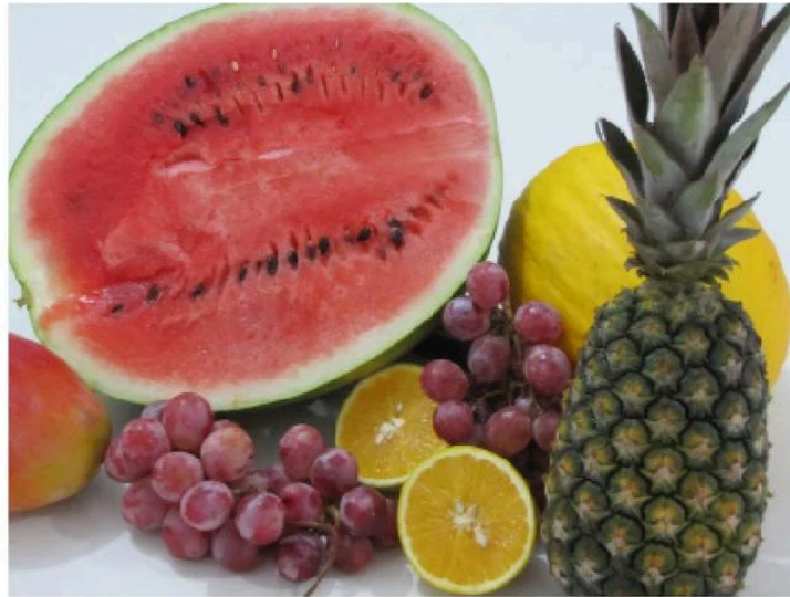
Alimentos com grande quantidade de água na composição devem ser priorizados

Com o aumento da temperatura no verão, o organismo sofre alterações para manter-se estável, sendo a transpiração um desses mecanismos de controle. A nutricionista Jordana Colombo Torres recomenda beber, no mínimo, dois litros de água por dia, sucos naturais e água de coco, além de comer alimentos ricos em líquido, a exemplo de melancia, melão e