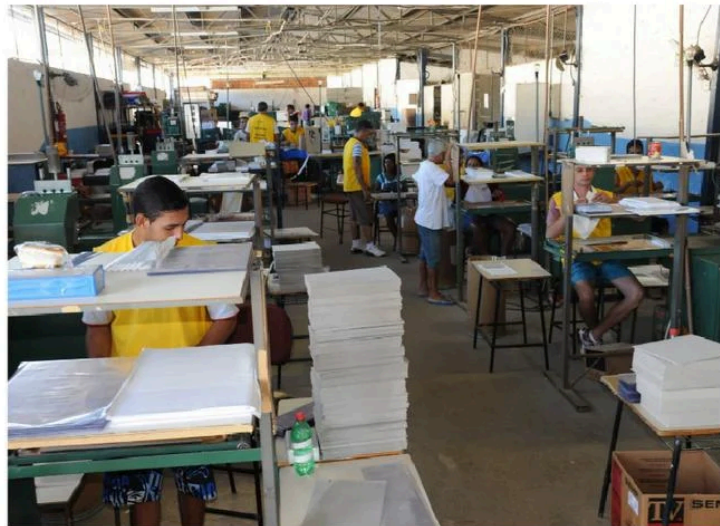
Custodiados do sistema goiano de prisão trabalham na indústria do papel

Os projetos realizados dentro da penitenciária são exemplos de iniciativas que auxiliam a reeducação dos presos.