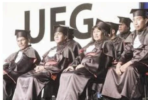
Primeira turma de Licenciatura Intercultural Indígena