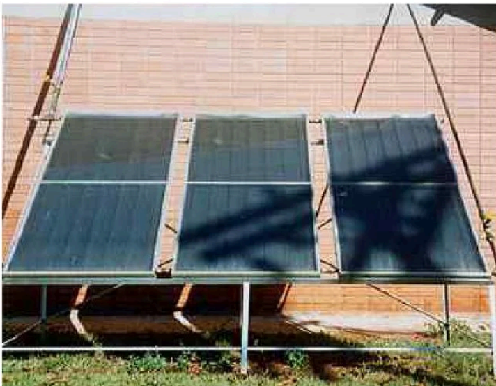
Placas de aquecimento solar na Creche da UFG geraram economia de dinheiro

Dados do Ipea indicam que a produção mundial de etanol cresceu aproximadamente quatro vezes entre 2000 e 2008. Brasil e Estados Unidos são os principais produtores mundiais, seguidos por China, Índia e França. O Instituto prevê que, em 10 anos, a produção do etanol deve dobrar no Brasil. Pensando nisso, 40 países já misturam o álcool à gasolina como forma de reduzir a emissão de gases que provocam o efeito estufa e a dependência de petróleo importado. (Ana Flávia Marinho)