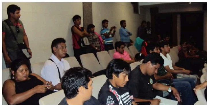
Estudantes indígenas assistem a palestra do curso na Faculdade de Letras