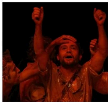
Cena do espetáculo Mumbuca/Borogodó

Esses centros possuem cursos em diversas áreas, sendo eles relacionados à música, dança, teatro e artes visuais. O CEPABF foi criado em 2002 como parte do Programa de Expansão da Educação Profissional do Estado de Goiás. A Escola de Artes Veiga Valle, criada em 1967, foi agregada ao Centro de Educação Profissional. Ambas estão localizadas no Setor Universitário. Dentre os projetos de destaque dessas instituições estão a Orquestra Sinfônica Jovem de Goiás, com 180 membros, e as turmas de dança, que já venceram festivais renomados